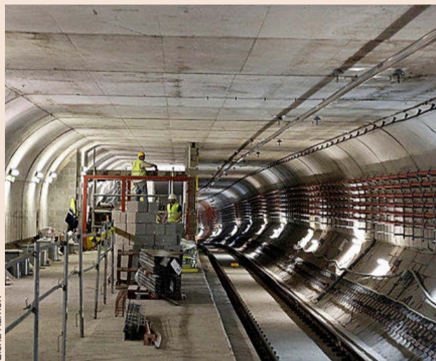
Línea 9 del metro de Barcelona.

La Consejería de Transportes de la Comunidad de Madrid se encuentra a la espera de que el Ministerio de Transportes concrete las líneas para establecer la financiación vinculada al Mecanismo de Recuperación de la UE. En todo caso, "ya trabajamos sobre varios proyectos que podrían optar a esta financiación, ya que suponen un gasto de inversión y están en línea con los Objetivos de Desarrollo Sostenible marcados por Eu-