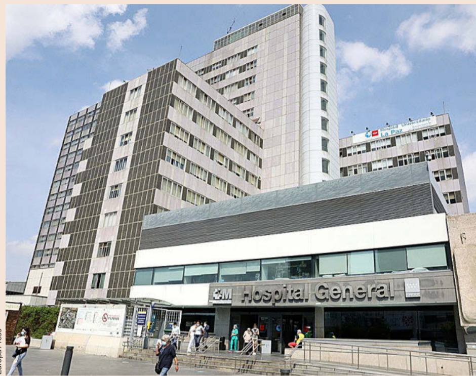
Hospital de La Paz de Madrid.

ropa. Entre ellos, las ampliaciones de las líneas 3, 5, 8 y 11 de Metro de Madrid o la compra de 67 nuevos trenes para el suburbano madrileño", indican desde la Consejería de Ángel Garrido. El Gobierno madrileño dispone proyectos para esta legislatura de unos 2.000 millones de euros entre obras ferroviarias y viarias.